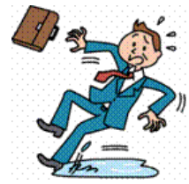
車にはねられてケガ 地震で足を踏み外し骨折 火災によるケガ 滑って転倒