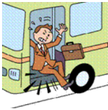
バスの降り口で転倒

日本国内・国外問わず、所定の交通乗用具との衝突、接触等の交通事故または交通乗用具に搭乗中の事故によりケガをされた場合等に、保険金をお支払いします。