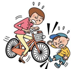
買物中売り場の商品を壊してしまった。 スキー中他人にぶつかりケガを負わせた。 愛犬が他人にかみついてケガを負わせた。 自転車で走行中に事故