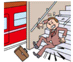
地震による駅構内での転倒